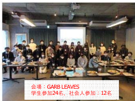
会場：GARBLEAVES 学生参加24名、社会人参加：12名