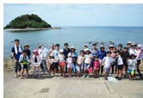
【子育て環境を考える会】