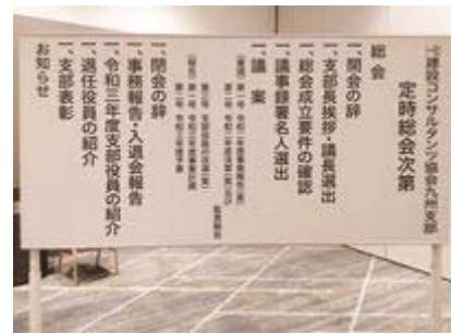
▲令和3年定時総会の様子