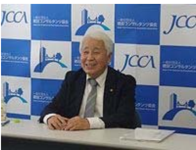
▲新支部長就任記者会見の様子