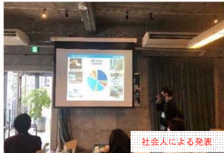
社会人による発表

就職活動を控えた学生と若手技術者が意見交換をすることで、学生に有益な情報を提供すると同時に若手技術者も「初心に戻り、やりがいを振り返る」ことを目的とした交流会が行われました。