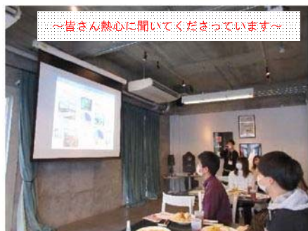
～皆さん熱心に聞いてくださっています～

今後も若手技術者委員会と連携しつつ学生さんに有益な情報を提供できるよう、様々な工夫をしていきたいと思ひます。