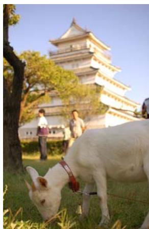
【ヤギ・羊 ECO プロジェクト】

過去18回の夢アイデアの募集の中には、実現に向かって動いているプロジェクトもあります。過去の応募作品は「夢アイデア」のホームページに掲載し、Facebookでも情報発信しています。夢アイデア応募の参考に、まちづくりのアイデアに、ぜひご覧ください。