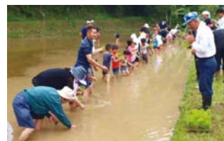
【九州郷づくり共助ネットワーク研究会】