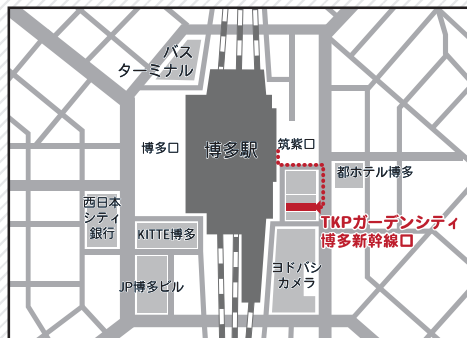
【夢アイデア交流会 配信会場：TKPガーデンシティ博多新幹線口 地図】