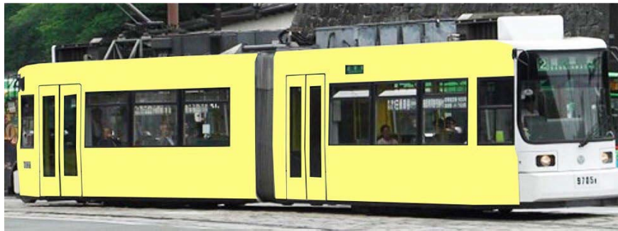
外観もアート作品でラッピング