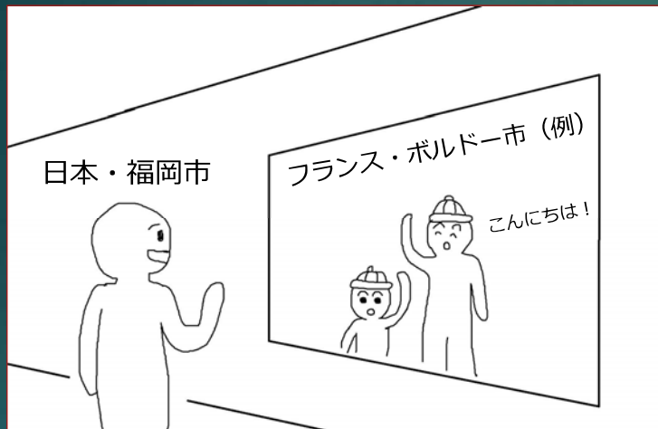
図1 双方向壁面モニターの設置イメージ

テレビ電話のように常時接続する。接続場所は姉妹都市の中心部で公共性が高い場所、福岡側は天神や博多。付加機能としてリアルタイムの画面内文字翻訳 & 音声翻訳が行えると良い。以下に図を示す。