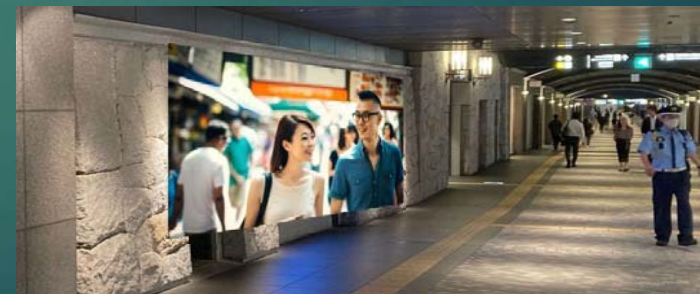
図4 双方向壁面モニターの設置例 (天神地下街)