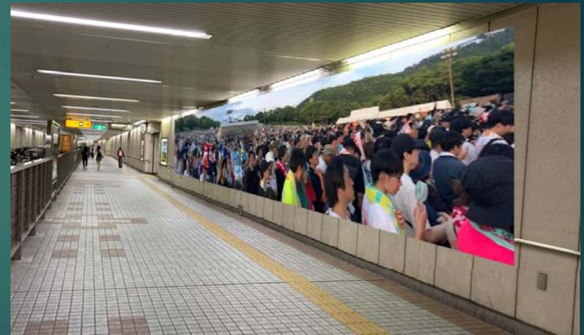
図5 壁面モニターの設置例（博多-祇園間連絡通路）

公共の施設として街中に巨大な壁面モニターを設置し、海外と接続する。人々は独自にコミュニケーションを取り、お互いの文化を共有する。昔からのお祭りや世界水泳のようなイベントを景色として保存し、未来に残すことができればとても有意義なものになると考える。