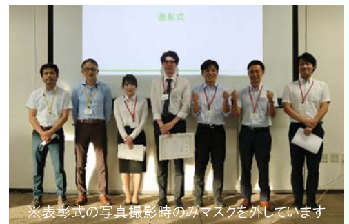
若手技術者交流会の様子