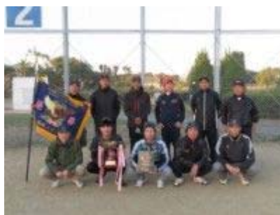
▲優勝の西日本技術開発(株)