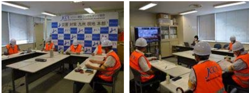
▲大規模災害対応演習の様子

内容 ■ 宮崎県 日向灘沖を震源とするM7.6の地震が発生し、津波により各種の被害が生じているものと想定し九州支部に災害対策九州現地本部を設置、支援要請内容の確認を災害対策本部および（九州地整）リエゾン、各建コン対策支部とWEB会議で行った。 ■ 九州支部では会員会社に被害状況や必要な支援物資等を調査、同時に災害支援の現地調査に関する派遣技術者（テックフォース同行技術者派遣要請）の可否について確認訓練を行った。