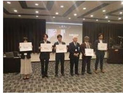
▲夢アイデア交流会 2022 の様子