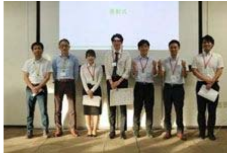
▲若手技術者交流会の様子