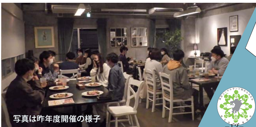
写真は昨年度開催の様子