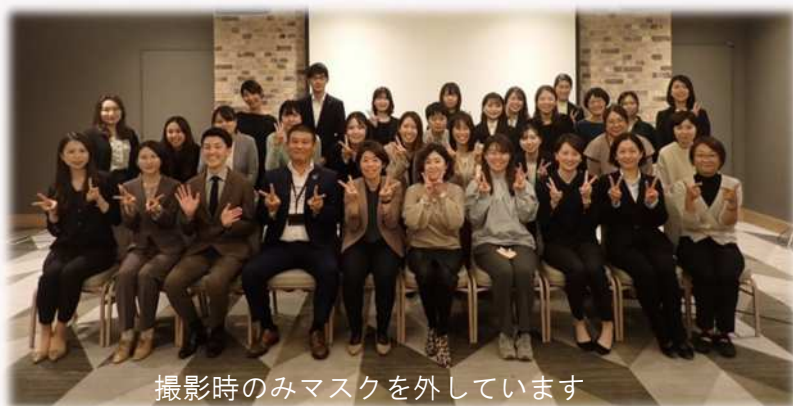
撮影時のみマスクを外しています

今回も2部構成で「十人十色の働き方～あなたは何色を選びますか？」をテーマに、第1部でライトニングトーク、第2部では「ワールドカフェ形式」の意見交換会を行いました。