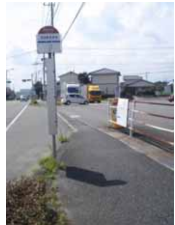
コンビニ前のバス停

私はコンビニで働いているが、バスの待ち時間に「店内で待たせて」「暑いから少し居させて」などと駆け込んでくるお客さんの姿をよく目にする。また、養護施設から来られる人は時間がかかるため、途中のスーパーやコンビニなどで休みながら移動されている。私も駅やバス停での待ち時間、夏場などはとても暑い思いをした経験がある。また、梅雨の時期には雨を凌ぐ場所を探すのに一苦労した事もある。しかし、わざわざお店などの店内へ入り休憩しようとは思わない。私が思うのと同じように、ただ、ちょっとだけ座って休みたいだけの方も多々いるのではないかと感じる。