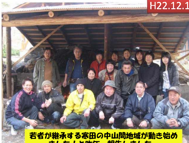
若者が継承する寒田の中山間地域が動き始め ました!と昨年、報告しました。 (寒田一番星・真ごちの里・椎田「夢」会議)