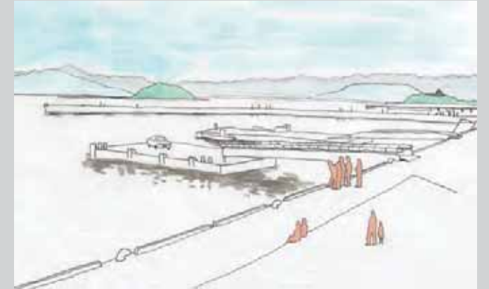
▲ 旧玄海ヤンマー倉庫から玄界灘、鳥島を臨む

玄界灘沿いの水辺空間と九電工場側を隔てるように存在する旧ヤンマー倉庫。この場を新たな市民のための活用スペースとするために画期的な提案をしました。そこには市民が見慣れた玄界灘の美しい風景が存在します。隔たれた場と場をつなぎ、今までと違った風景を作ることが目的です。