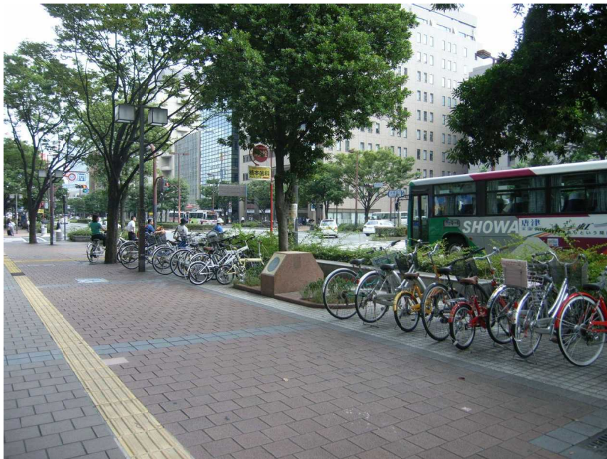
駅まで乗る人の昼間置かれた自転車