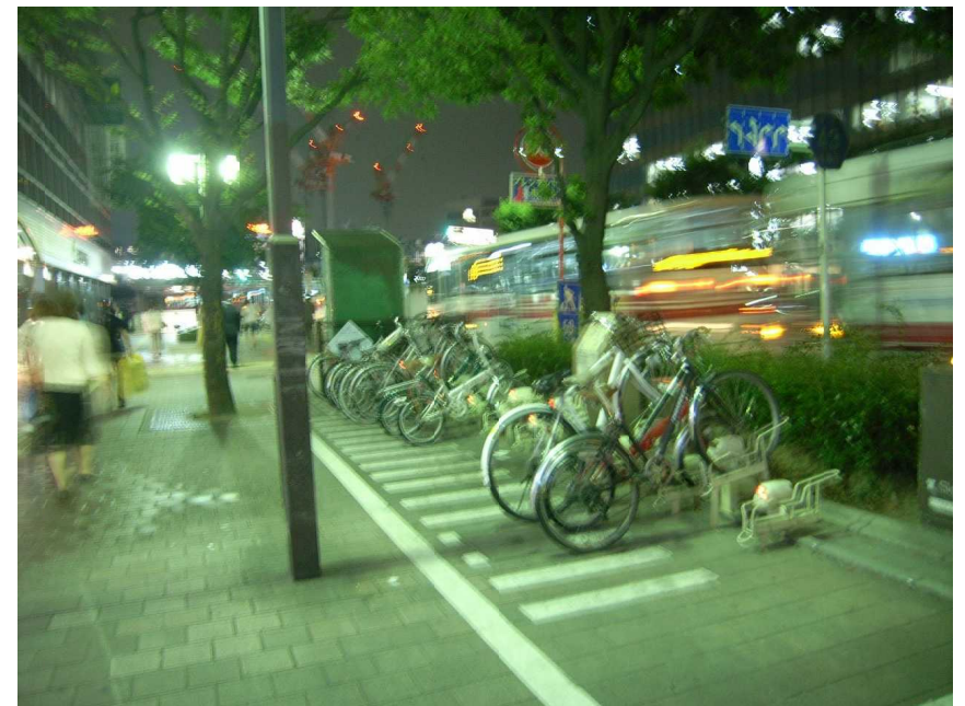
駅から乗る人の夜間置かれた自転車