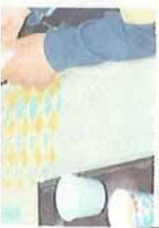
あげた子どもたち