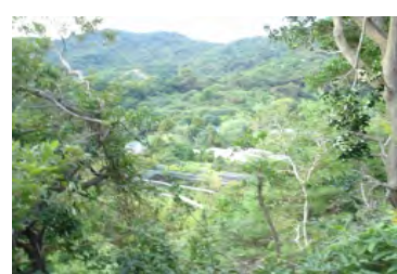
写真 1 ～ 6 志摩にある荒地の例