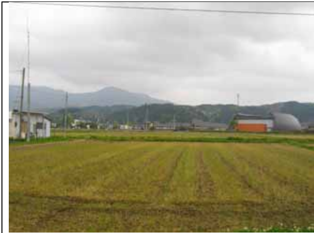
自宅南側より（右丸い屋根は蛭ミュージアム）