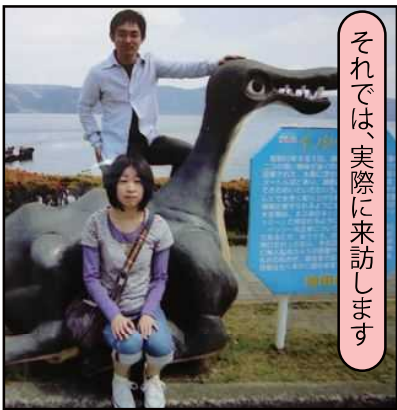
※鹿児島県指宿市の池田湖です。

※来訪ポイント制度とは、登録された観光地を訪れることでポイントを得て、商品と交換する制度です。GPS機能付き携帯とQRコードを利用することで、わずらわしい作業なく、ポイントを申請できます。ただし、GPSによる位置確認があるので、現地申請しないとポイントはもらえません。