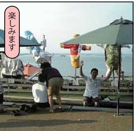
※道の駅たるみずの足湯は日本で2番目に長い? 足湯です。(1番は桜島です)