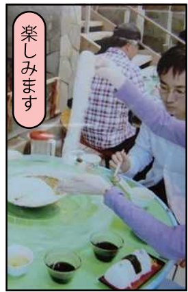
※唐船峡そうめん流しです。