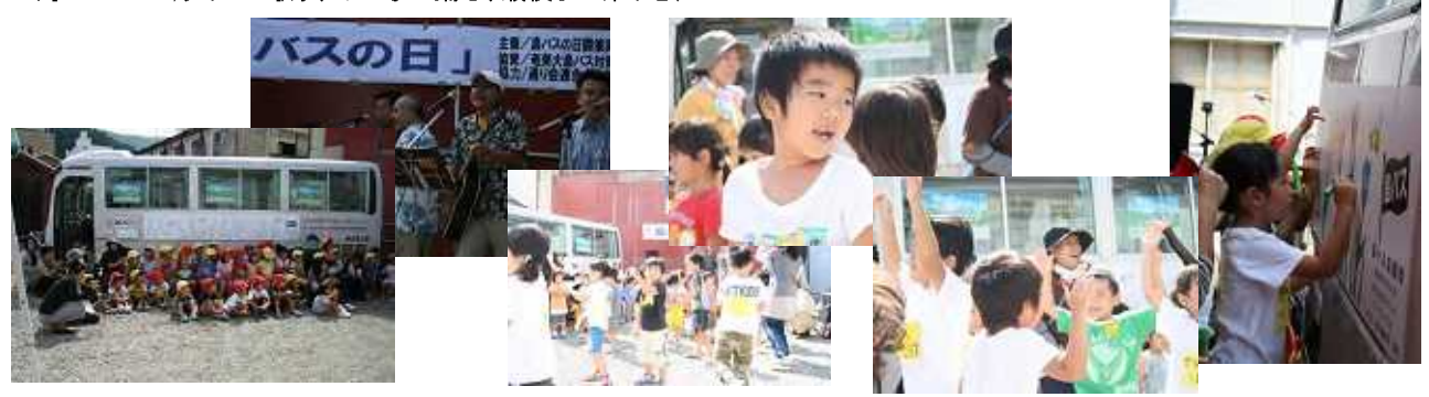
島バスの日(ライブで歌う、みんなが踊る、最後まで楽しむ)

（サポーター） 各店舗、道の島交通、金久保育園のみなさん、市民、訪れる人 ■ CD の販売サポート ■ 島バスの日イベントライブの開催 ■ 保育園児たちによる、「島バスに乗って」のダンス その他もろもろ