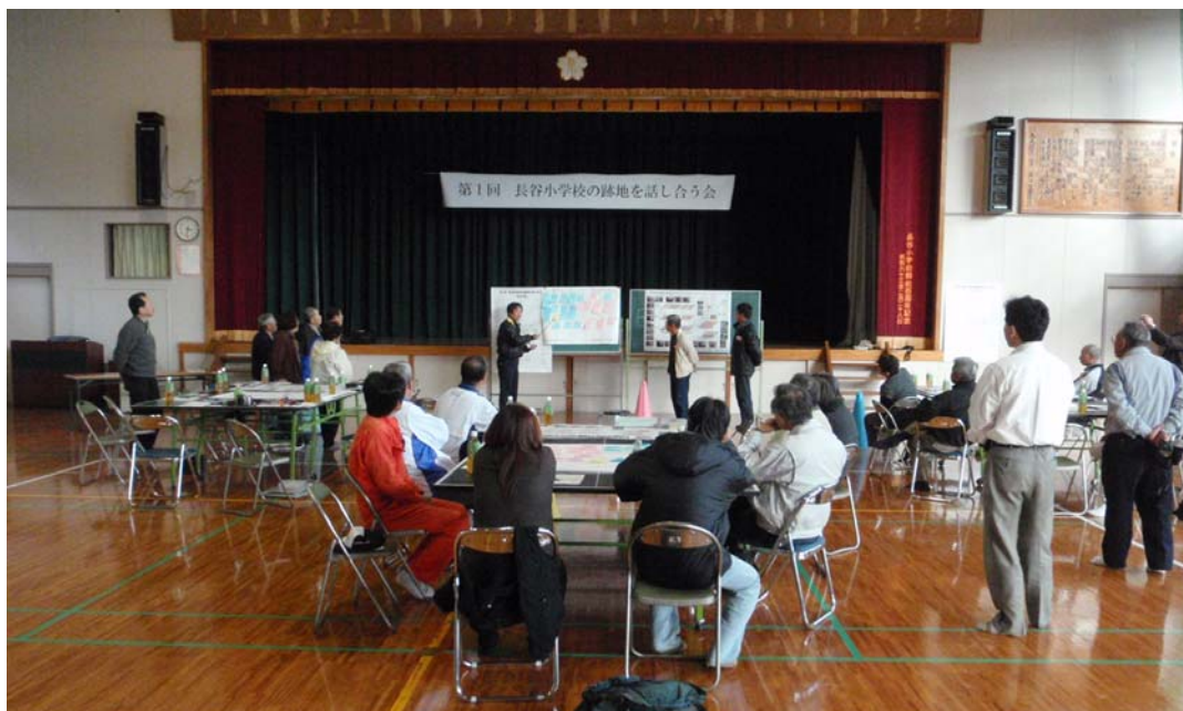
班別の発表会の様子

皆さん約束の10分間を超える熱弁をふるわれ、他班の方もひとつひとつにうなずきながら、聞き入っていました。(出された意見のまとめを、2.に整理しています。)