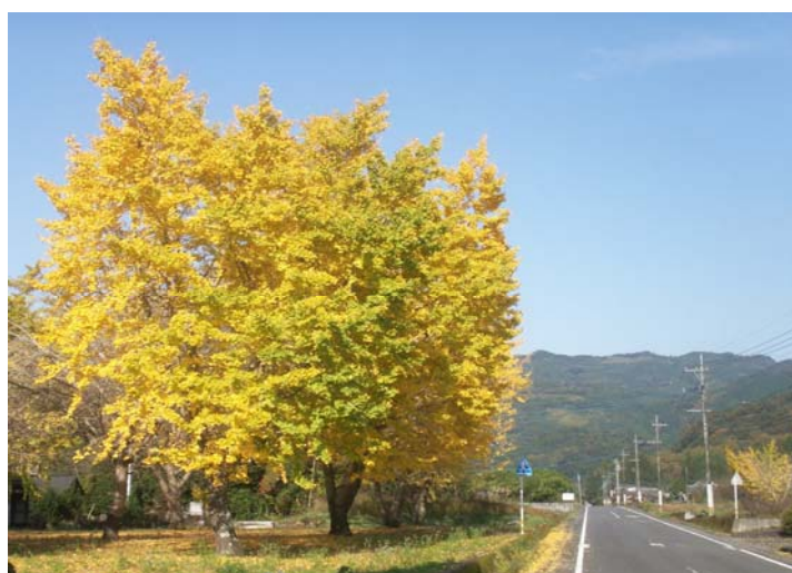
朝、学校に向かう途中で見かけた 銀杏の見事な黄葉